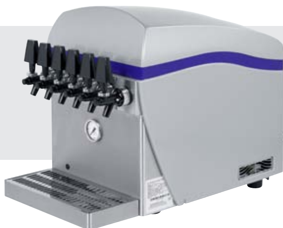
Icon Micro Dry Design